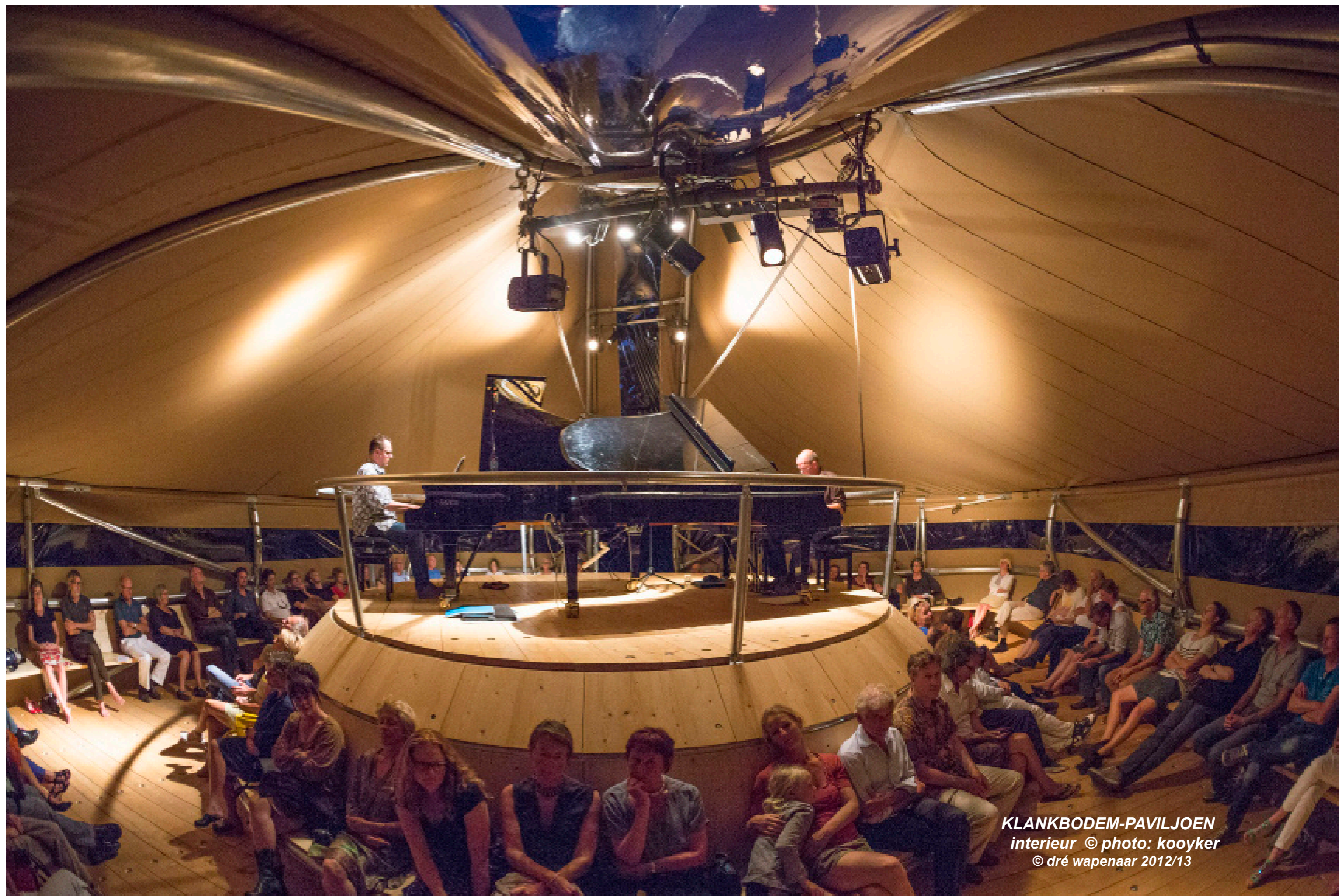
KLANKBODEM-PAVILJOEN interieur © dré wapenaar 2012/13